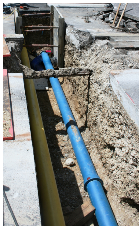
Mennicke verlegte eine Brauchwasserleitung DN 200 im Industriepark Gersthofen.

Die Einbindungen in das vorhandene Leitungssystem mit Formstücken der Sonderdimension DN 450 und die Inbetriebnahme erfolgten Ende Oktober. ■